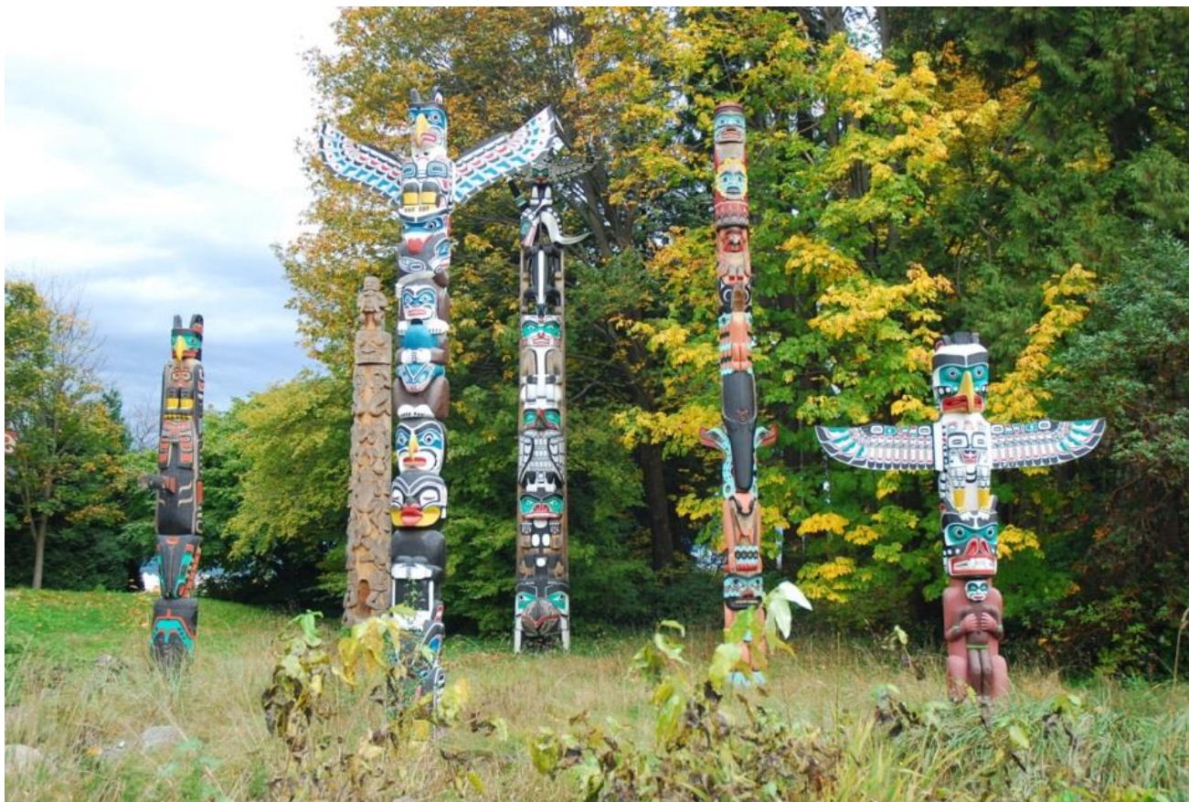
Totemy indiánů kmenů Squamish a Lí'lwat v západní Kanadě