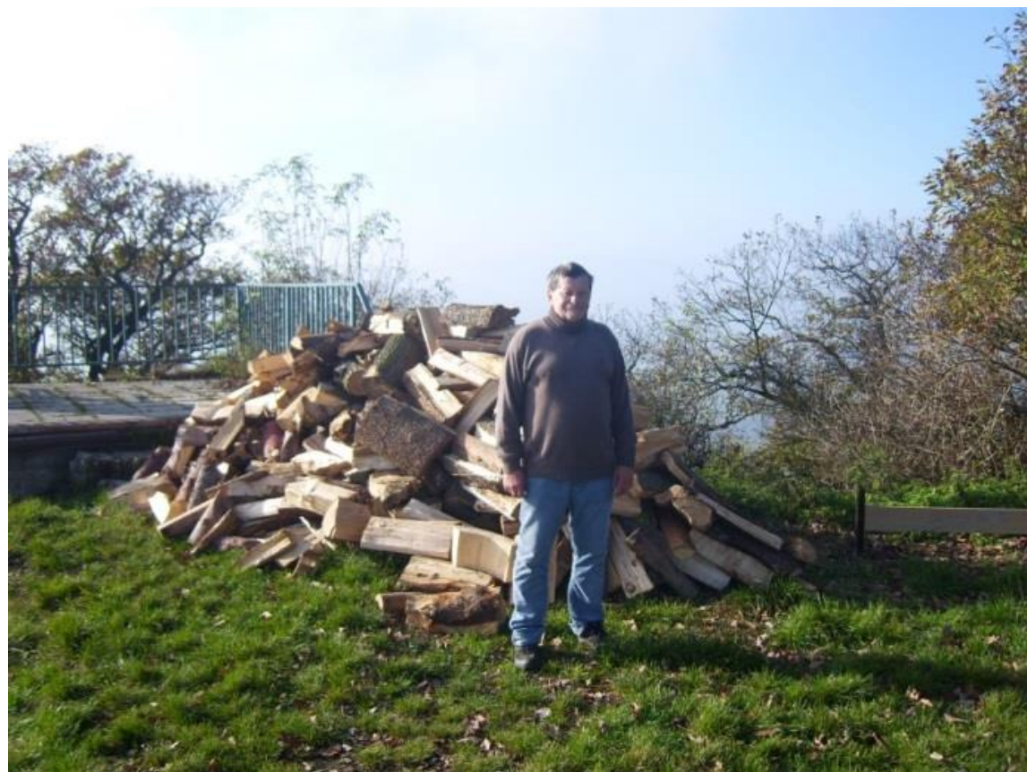
...Bobánek přemýšlí, kolik dříví za život nadělal... .