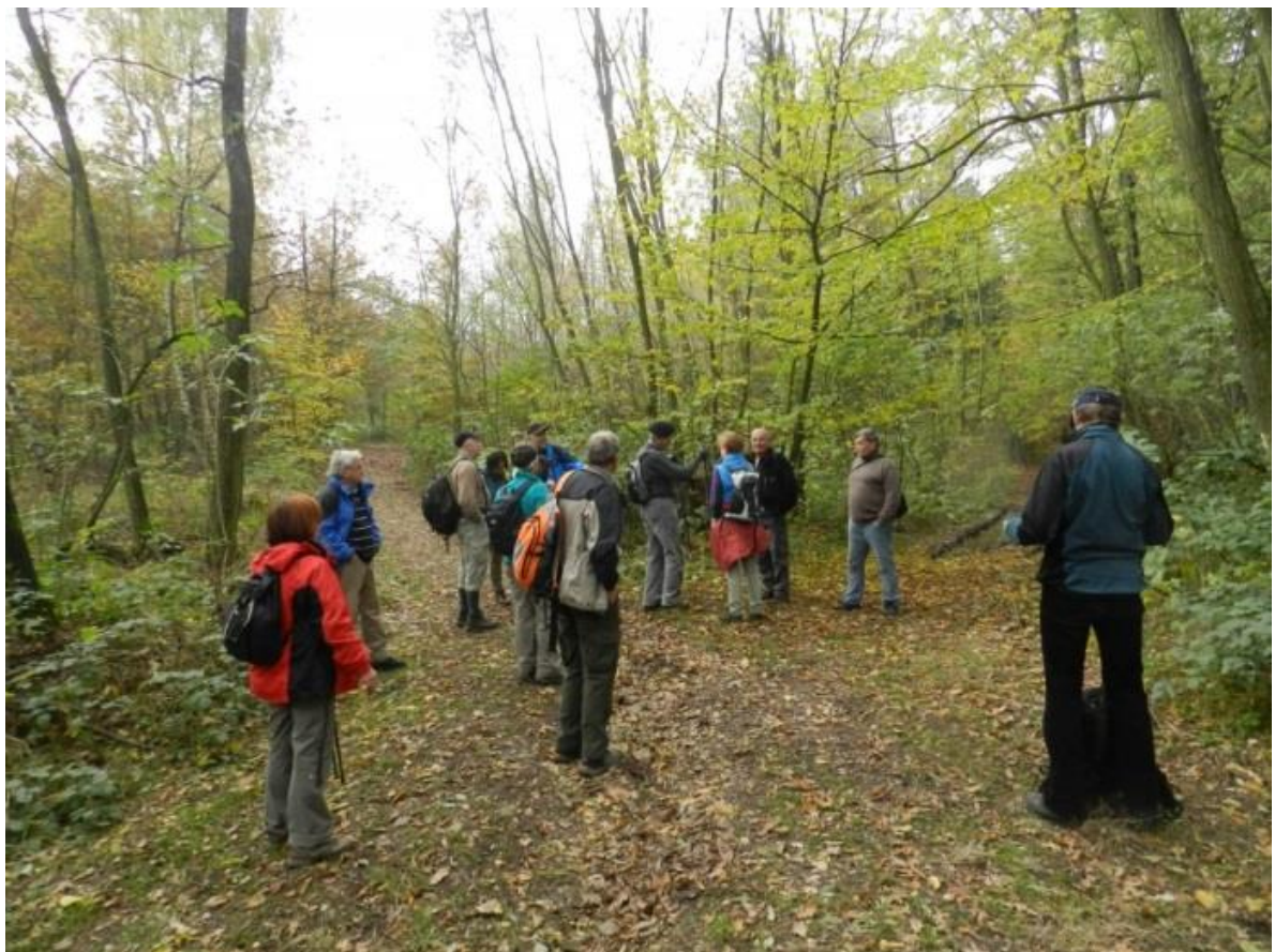
... malebnou podzimní krajinou vzhůru k vrcholu...